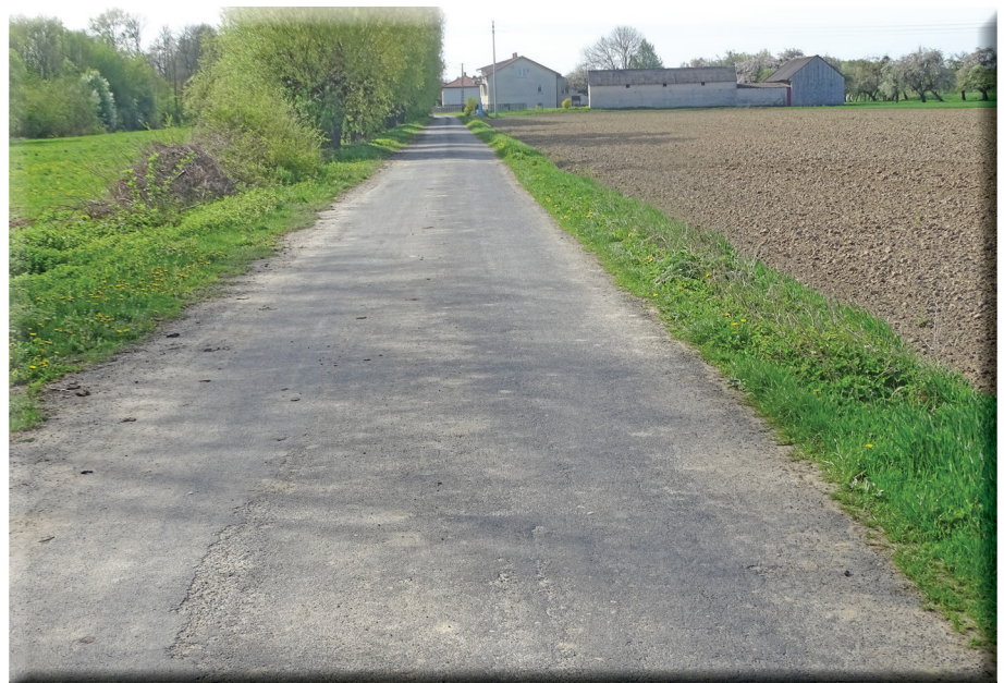
Stan nawierzchni przed remontem

Zadanie zostało dofinansowane ze środków budżetu Województwa Mazo-